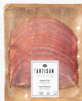
Ardense Filet Langzaam gerijpt