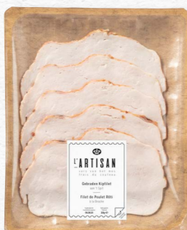
Gebraden Kipfilet Aan 't spit