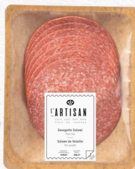
Gevogelte Salami Puur Kip