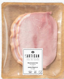
Meesterlycke Ham Puur Belgisch