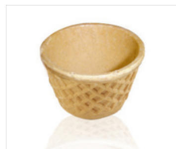
310005 Cup mignon 15 ml