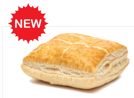
121176 Bladerdeeg doosje vierkant