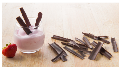
811029 Schaafsel puur 2,5kg