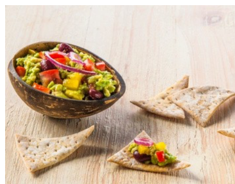
444001 Aperodipper kruiden 800g