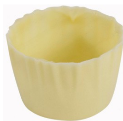
233001 Juliette cups wit